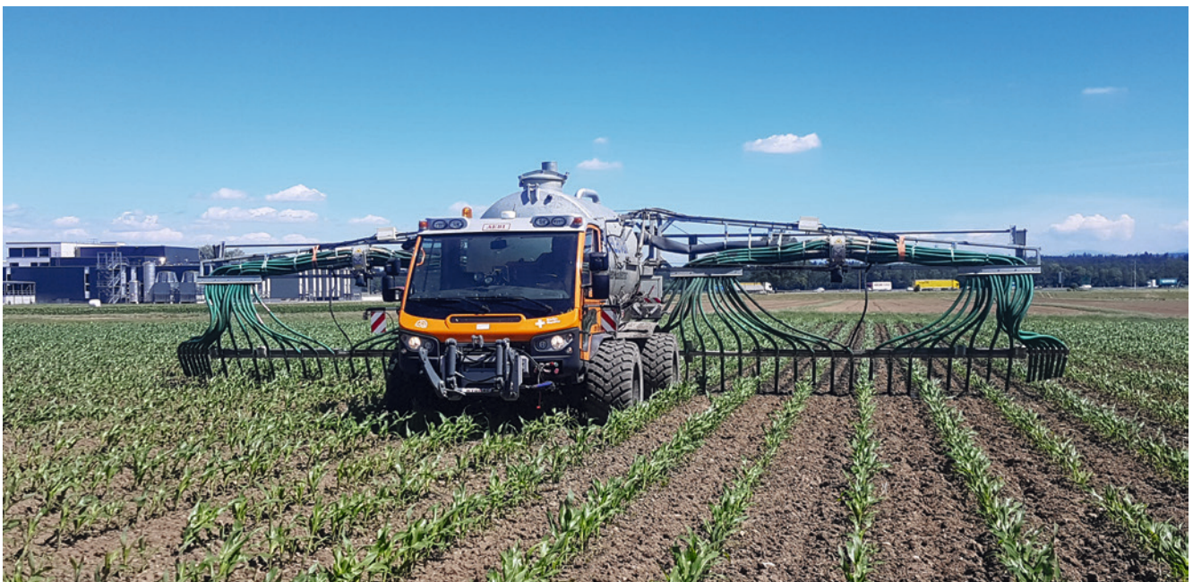
Muss die Beseitigung des Reinigungswassers im Feld erfolgen, so sollte dieses so breitflächig wie möglich ausgebracht werden, A. Bobst.

Es besteht die Möglichkeit, das Reinigungswasser aus der Innenreinigung als Spritzensumpf in der Spritze zurückzubehalten. Dieser kann dann zum Anmischen der nächsten Spritzbrühe wiederverwendet werden, wenn in kurzen Zeitabständen wiederholt mit dem gleichen Wirkstoff behandelt wird. Damit kann die anfallende Menge an Reinigungswasser reduziert werden.