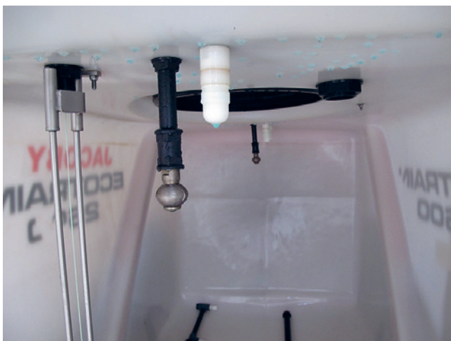
Spritzentank mit Innenreinigungsdüse, agrotop.