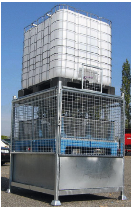
Physikalische Behandlungssysteme basieren auf dem Verdunsten des Abwassers und den Rückhalt der PSM-Rückstände in entsprechenden Filtermedien, CCD SA.