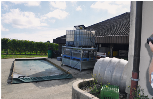
Mobiler Reinigungsplatz: Das Reinigungswasser wird bei Verwendung fortlaufend in den Rückhaltetank abgepumpt. Aufgrund fehlender Überdachung muss die Blache nach der Benutzung abgebaut werden, um ein Überlaufen bei möglichen Regenereignissen zu verhindern, M. Hochstrasser.