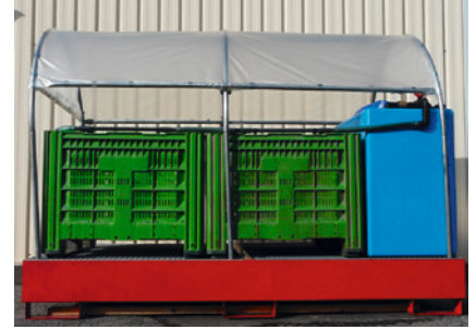
Biologische Behandlungssysteme ermöglichen den Abbau der PSM-Rückstände durch Mikroorganismen, CCD SA.

Grundsätzlich wird empfohlen, das gesammelte Reinigungswasser über eine Sammelvorrichtung dosiert einer Spezialbehandlung zuzuführen. Die entsprechenden Behandlungssysteme werden von Bund und Kantonen finanziell gefördert . Aus Sicht der Risikominimierung wird empfohlen, Behandlungssysteme zu verwenden, welche geschlossen betrieben werden, d. h. bei denen nach erfolgter Behandlung kein behandeltes Restwasser zurückbleibt. Bei einem nicht geschlossenen Behandlungssystem, bei dem nicht alles Reinigungswasser verdunstet oder wieder ins Behandlungssystem eingebracht wird, ist das anfallende Überschusswasser aufzufangen und z. B. für das Anmischen neuer PSM-Brühe zu verwenden oder im Rahmen einer vertraglich geregelten Abgabe bei einem Spezialunternehmen zu entsorgen.