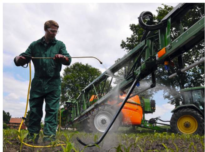
Aussenreinigung einer Feldspritze mit einer Reinigungslanze auf bewachsener Fläche, G. Höner.