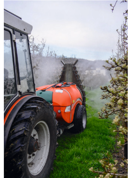
Die Verunreinigung der Maschinen mit PSM kann insbesondere bei Gebläsespritzen erheblich sein, D. Dietiker.

Die Aussenreinigung auf der Parzelle ist effizient, da Ablagerungen an der Spritze noch nicht eingetrocknet und somit einfacher abzuwaschen sind. Benutzen Sie dazu eine Reinigungslanze, die am Spülwassertank angeschlossen ist, oder einen Hochdruckreiniger mit Dosiereinrichtung für den Zusatz von Gerätereinigern. Sie können auch eine Waschbürste einsetzen. Der Anschluss ist mit Systemen zur Innenreinigung kombinierbar, weshalb sich eine gleichzeitige Anschaffung lohnt . Für Neugeräte sind entsprechende Systeme als Option erhältlich. Für bestehende Spritzen gibt es Bausätze zur Nachrüstung.