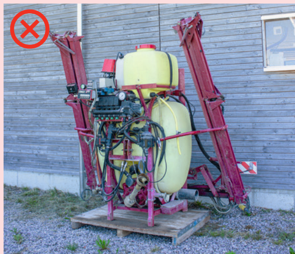
Hier macht man weder der Spritze, noch der Umwelt einen Gefallen: Ist das Gerät der Witterung exponiert, kann kontaminiertes Regenwasser in die Meteorentwässerung gelangen, M. Rösch.

Nach dem Gebrauch (bzw. nach der Reinigung) ist die Spritze grundsätzlich zum Schutz gegen Regen in einem überdachten Bereich oder mit einer mobilen Abdeckung (z. B. Plane) abzustellen. Um Unfälle zu vermeiden, sollte sich der Abstellplatz nicht an einem Durchgang sowie ausserhalb des Zugangsbereichs von Kindern befinden.