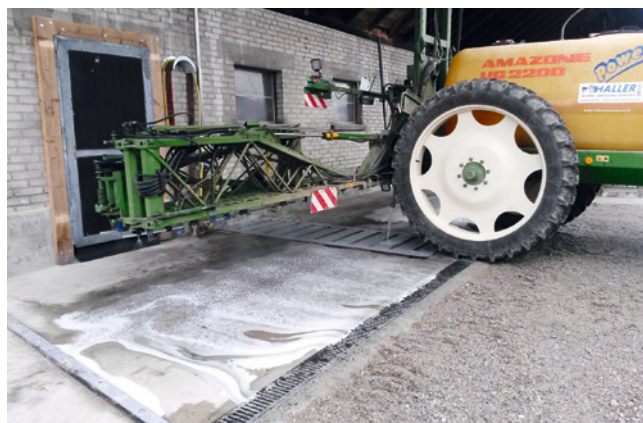
Das Spritzgestänge ragt nicht über den Waschplatz hinaus und alles Reinigungswasser gelangt via Drainagegitter in den Rückhaltetank, Th. Haller.

Eine Überdachung des Waschplatzes ist nicht obligatorisch, wird jedoch empfohlen. Ein Dach verhindert, dass unbelastetes Niederschlagswasser beim Abfließen mit Spritzmittelrückständen verunreinigt wird. Bei fehlender Überdachung des Waschplatzes muss der Niederschlagsanfall in der Berechnung der Lagerkapazität des Hofdüngerlagers respektive des Sammelbehälters mitberücksichtigt werden.