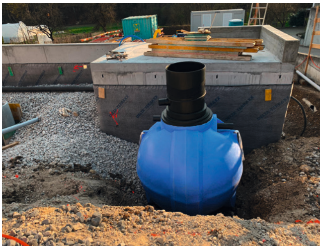
Ein unterirdischer Rückhaltetank muss zwingend doppelwandig und frostsicher sein, Ripalco AG.