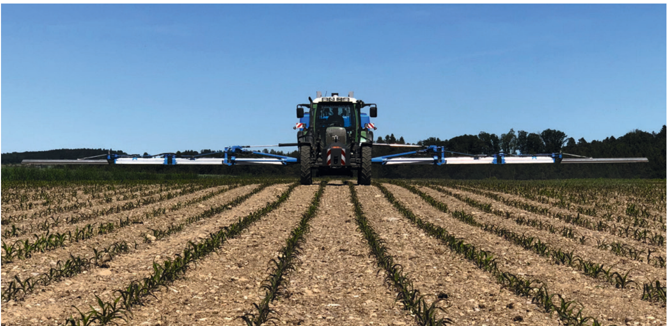
PSM gehören auf die zu behandelnde Kultur - jeder noch so kleine Tropfen im Gewässer ist fehl am Platz, S. Binder.

Das Reinigungswasser aus einer Lagervorrichtung ohne Zusatz von Hofdünger oder flüssigem Gärgut kann jederzeit und ohne Einschränkung bei einer Sonderabfallsammelstelle zur Behandlung abgegeben werden.