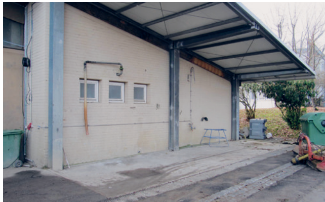
Platz zum Befüllen der Spritze: Überdachter Betonplatz mit Auffangrinne sowie praktischem Schlauchgalgen, B. Arnold.

Die Verwendung einer dichten Blache oder einer Auffangwanne mit angehobenem Rand oder einer Randbordüre (mindestens 15 cm) als mobiler Befüllplatz ist zulässig. Der mobile Befüllplatz ist sowohl auf dem Betrieb als auch im Feld nutzbar. Da ein Befüllen des Spritzgeräts auf ungeschütztem bewachsenen Boden nicht zulässig ist, bietet er sich insbesondere als Lösung im Feld an, vor allem für das Befüllen von Geräten mit kleineren Tankvolumina (z. B. Rückenspritzen oder Spritzgeräte für Kleinparzellen im Obst- und Weinbau). Die Materialisierung muss UV- und witterungsbeständig sein und einen hohen Widerstand gegen mechanische Einwirkungen besitzen. Wird eine Blache verwendet, so ist diese auf einen steinlosen festen Boden oder auf einen zusätzlichen Kunstfaserfilz zu legen. Falls nicht überdacht, ist der mobile Befüllplatz nach jedem Gebrauch unbedingt zu reinigen und wegzuräumen , damit kein Niederschlagswasser in die Auffangvorrichtung gelangt und zu einem Überlaufen führt.