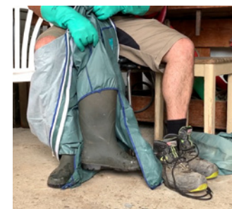
...ma evitando di toccarne l'interno.