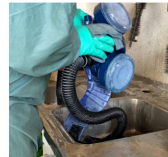
L'esterno dei DPI è sempre manipolato indossando i guanti...